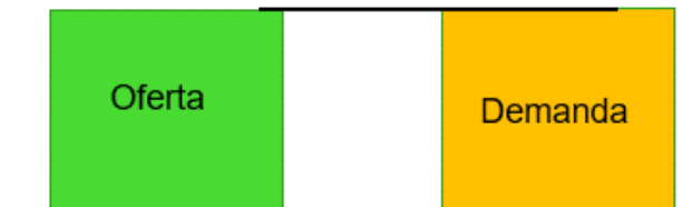
Ilustración 2. Esquema Caso 2. Asignación