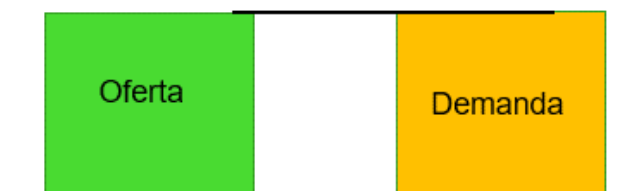
Ilustración 2. Esquema Caso 2. Asignación