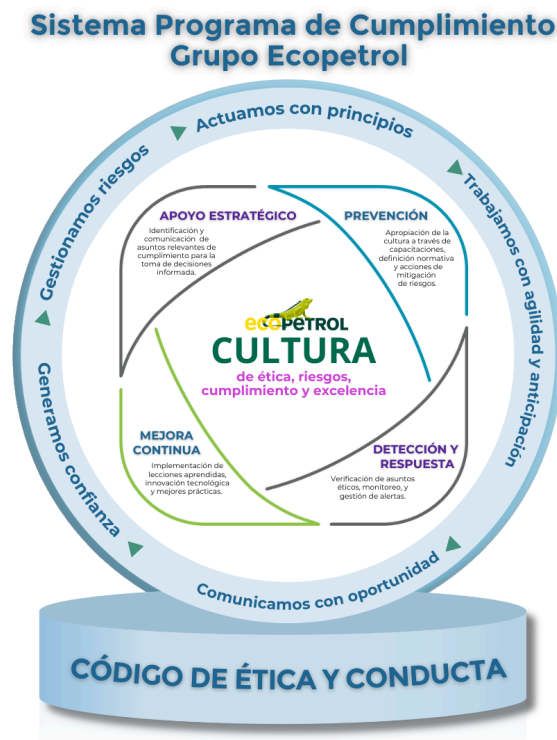
Gráfica No. 2 Sistema Programa de Cumplimiento - Grupo Ecopetrol

Para cumplir con el propósito de fomentar y elevar la ética, la prevención de riesgos, el cumplimiento y la excelencia; y posicionarla como el eje central de una gestión basada en la administración integral de riesgos, un comportamiento ejemplar y coherente y un sentido de excelencia organizacional que se cimiente sobre la confianza, la honestidad y el respeto por el marco ético, el Sistema Programa de Cumplimiento se apoya y desarrolla en cuatro ejes esenciales: apoyo estratégico, prevención, detección y respuesta y mejora continua.