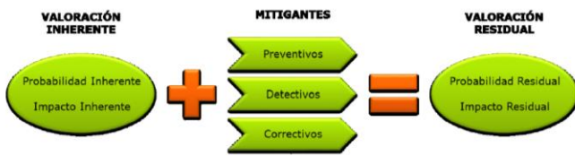
Figura valoración inherente y residual