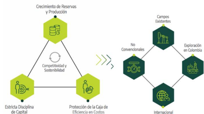
Estrategia Grupo Ecopetrol

La estrategia vigente del Grupo Ecopetrol atiende los desafíos del entorno, buscando mantener la competitividad y la sostenibilidad en escenarios de mayor volatilidad. Ecopetrol seguirá orientado estratégicamente hacia la creación de valor como grupo empresarial integrado. Los pilares de esta estrategia son el crecimiento en reservas y producción cimentado en la estricta disciplina de capital y la eficiencia en costos y protección de la caja.