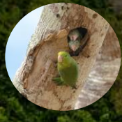
Especies de fauna objeto de caza