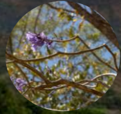
Especies nativas maderables