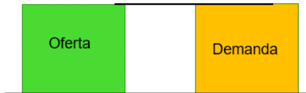
Ilustración 2. Esquema Caso 2. Asignación