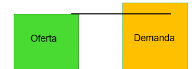
Ilustración 3. Esquema Caso 3. Prorrata