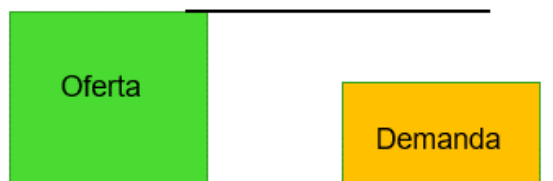
Ilustración 2. Esquema Caso 1 Asignación.