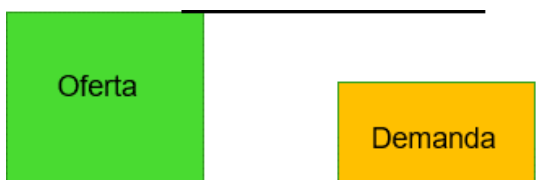
Ilustración 1. Esquema Caso 1. Asignación. (Oferta>Demanda)