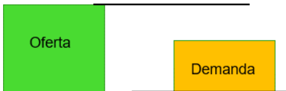
Ilustración 4. Esquema Caso 1. Asignación. (Oferta>Demanda)