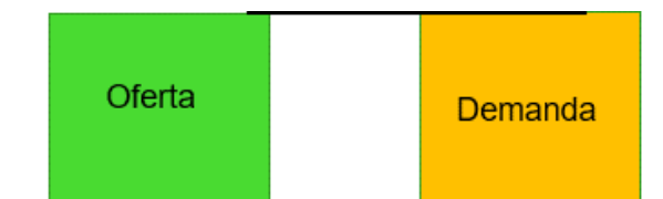
Ilustración 2. Esquema Caso 1. Asignación. (Oferta=Demanda)