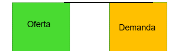
Ilustración 5. Esquema Caso 1. Asignación. (Oferta=Demanda)