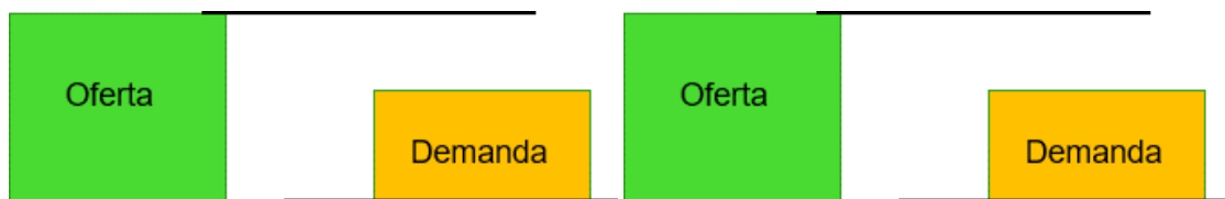
Ilustración 1. Esquema Caso 1. Asignación. (Oferta>Demanda)